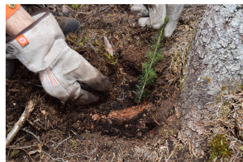
Pluggen skal være 2 cm under jorda. Sjekk at planten sitter godt.