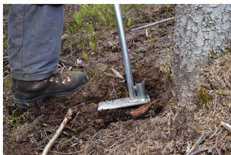
Med hullpipe eller plantespett lager Nico et hull til plantepluggen.