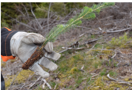
Det er viktig at pluggen får kontakt med jord rundt hele roten.