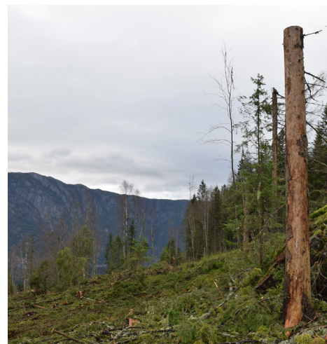
Høgstubben kappes 3 meter over bakken.