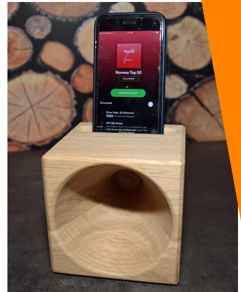
Høyttaleren i massiv eik sprer lyden godt.

NÅ HAR DE akkurat fylt opp lageret igjen. Om du vil, kan du bestille deg en miljøvennlig høyttaler på www.ecosoundas.no