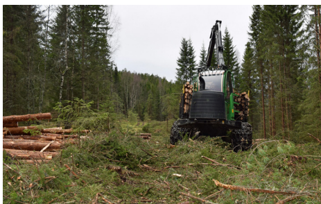
Maskinene kjører på kvist, som skåner skogbunnen.

kappes 3 meter over bakken og kalles høgstubber. Tørre trær skal alltid stå igjen der disse ikke er til fare for alminnelig ferdsel. Vi kan bruke skjønn og sette igjen flere livsløpstrær i ei gruppe om det er en