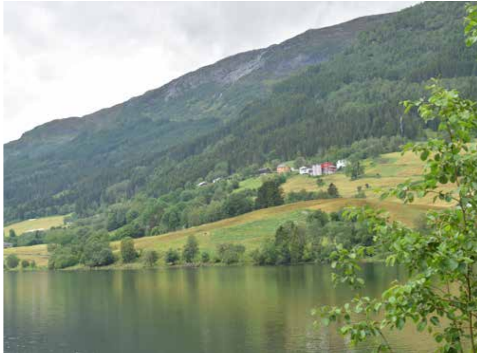
I liene på Vestlandet er det synlige plantefelt med hogstmoden skog.