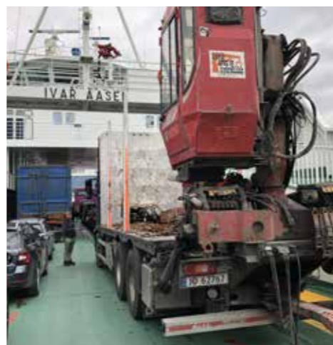
Med ferja mellom Hella og Vangsnes.