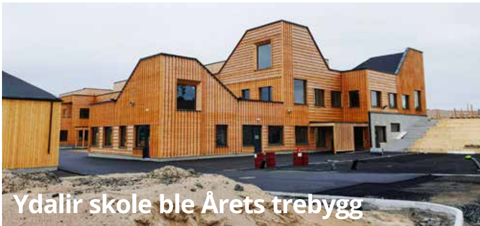
Ydalir skole ble Årets trebygg

Tenk Tre omtalte et nyskapende og bærekraftig trebygg hver måned i 2020. Alle kandidatene til Månedens trebygg kan du lese mer om på tenktre.no . Før sommeren inviterte vi til avstemning på